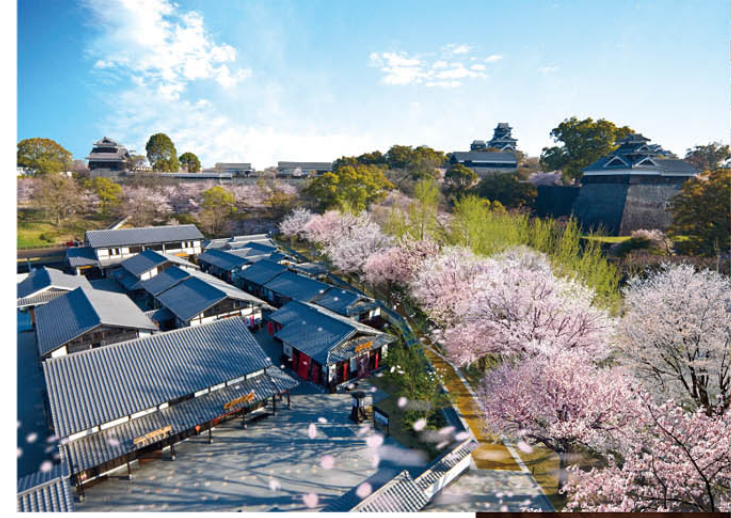
KUMAMOTO - SPECIALTY GIFT