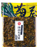
油炒め高菜(菊屋オリジナル) 435円(150g)

🕒 180日 📦 冷蔵 📺 可 🗣️ 可(電話のみ/0120-096-734) 📱