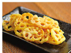
森からし蓮根風味チップス 864円(1箱5袋入)

🕒 10日 📦 冷蔵 📺 可 🗣️ 可(インターネット、電話/096-351-0001)