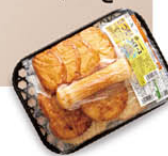
高田蒲鉾詰合せ A 2,240円(5種類)

「高田蒲鉾」自慢のねり製品が一度に楽しめるお得なセット。芦北の美しい海でとれたハモや太刀魚(たちうお)入りの天ぷら、ちくわにプロセスチーズがたっぷり入った「ちくチーズ」など、人気メニューがズラリ。芦北が誇る海のおいしさを存分に楽しめる、ボリューム満点の内容です。