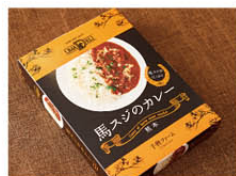
馬肉スジカレー 660円(210g)

長時間煮込んだ馬スジがたっぷりに入ったレトルトカレー。馬スジのうま味と野菜や果物のまるやかな甘み、スパイスの風味が調和した技ありの一品。