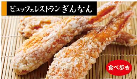
ピュッフェレストラン ぎんなん

自家製の平打ち麺、肉と野菜でダシをとった味噌仕立ての一杯です。 だご汁定食 1,000円(税込)