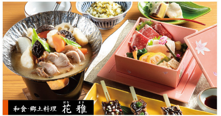
和食 郷土料理 花雅

馬刺しや団子汁など熊本を代表する郷土料理の御膳です。 肥後尽くし御膳 2,530円(税込)