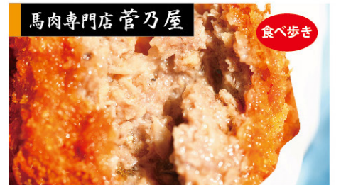
馬肉専門店 菅乃屋