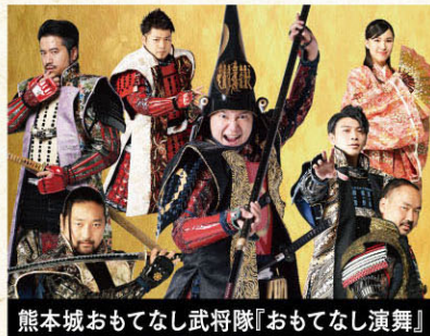
熊本城おもてなし武将隊『おもてなし演舞』

※この情報は令和6年12月19日現在の内容です。 催しもののスケジュールは変更になる 場合がございます。