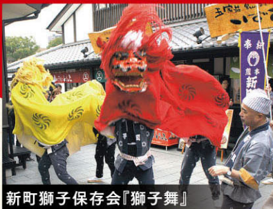
新町獅子保存会『獅子舞』