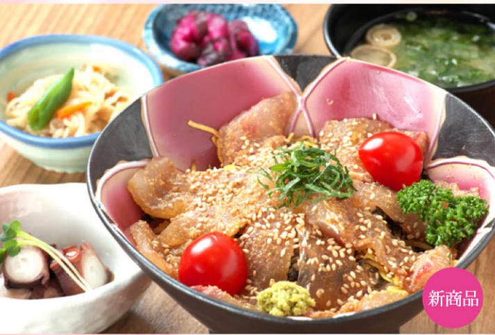
6 【天草海まる】 真鯛の胡麻しょうゆづけ丼 1,944円 3/1~3/20 各日20食限定 天草の真鯛を贅沢に使った丼。合わせ醤油に加えた熊本特産の赤酒が隠し味。