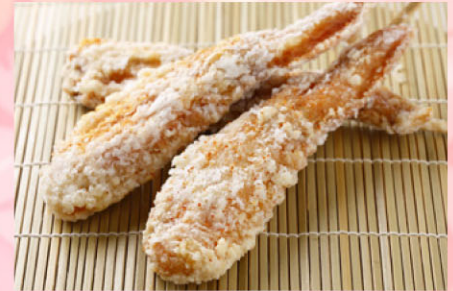
9 【旬彩館】 天草大王大手羽唐揚げ 800円(1本) 日本最大級の地鶏の歯ごたえ、「コク」ある旨味を手羽元から手羽先まで丸ごと1本、ダイナミックにお召し上がりください。