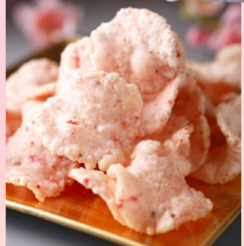
11 【阿蘇たかな漬物 菊屋】 阿蘇たかな新漬 540円(300g) 3月下旬~4月中旬限定 採れたての阿蘇たかなを塩と鷹の爪だけで味わう春限定の逸品です。