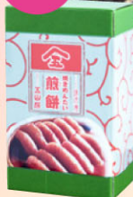
12 【五山房 巻の蔵】 焼めんたいせんべい(20枚入) 1,080円 ピリッと辛いサクサクせんべいに、「五山房 巻の蔵」自慢の国産明太子を使用したオリジナル!