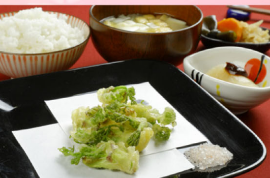
4 【阿蘇庵 山見茶屋】 たらの芽天ぷら定食 1,200円 4月中旬~4月下旬 各日20食限定 春の味覚、天然たらの芽の天ぷらです。採れたての味をご賞味ください。小鉢2品、団子汁、ごはん付き。