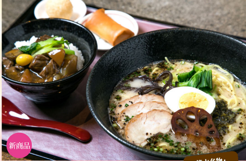
5 【肥後めしや 夢あかり】 熊本拉麺定食 1,600円 各日40食限定 とんこつスープと焦がしにんにく油を使ったラーメンと、馬肉を醤油で煮込んだミニ馬肉丼を一度に食べれる、お得なセットです。