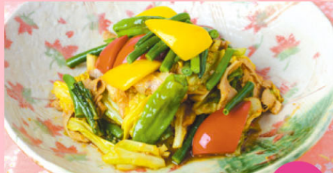
2 【ピュッフェレストラン ぎんなん】 熊本県産豚と春キャベツの回鍋肉 豚肉とキャベツに彩り豊かな野菜をトッピング。ごはんがすすむ、旨味噌風味のおすすめ料理です。 ピュッフェ料金：ランチ(90分) 平日大人1,500円・子ども750円、土・日曜・祝日大人1,800円・子ども900円/ディナー(120分) 大人2,680円・子ども1,340円(「豚しゃぶ鍋」又は「セイロ蒸し」食べ放題付き) ※大人は中学生以上、子どもは3歳~小学生以下