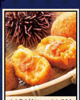
大人気の「うにコロッケ」。できた て、とろ~りアツアツをお召し上が りいただけます。