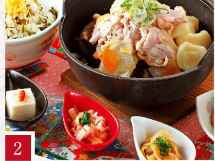
2 和食 櫻道 大阿蘇鶏団子汁御膳 1,480円