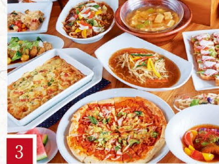
3 ビュッフェレストラン ぎんなん 季節の創作ビュッフェ【平日】 大/人1,500円 小/子ども 750円 【土日祝】大人1,800円・子ども900円

※写真はイメージです ※価格はいずれも税込です ※一部季節により取扱いのない商品や数量限定品がございます