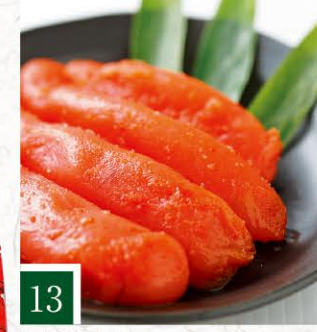
13 五山房 志の蔵 近海産赤酒明太子 【120g】 1,080円