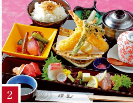
2 和食 櫻道 いちよう御膳 1,850円