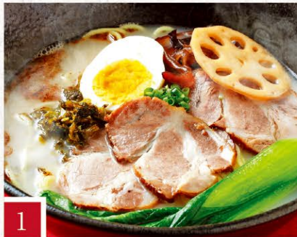
1 肥後めしや 夢あかり くまもとお城ラーメン 880円