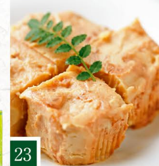
23 五木屋本舗 山うにと豆腐 オリジナル 【90g】 648円