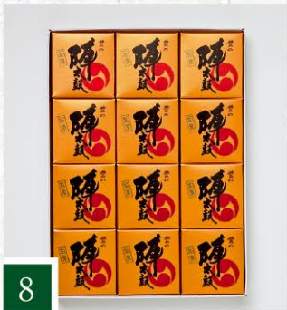
8 香梅庵 誉の陣太鼓12個入 【12個入】 2,074円