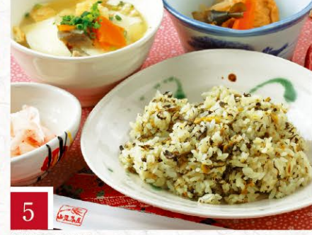
5 阿蘇庭 山見茶屋 たかなめし定食 1,200円