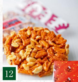
12 あんたがたどこさ 肥後太鼓 【8枚入】 1,031円