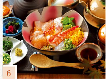
6 天草海食まるけん ぶっかけ海鮮づけどん 1,620円