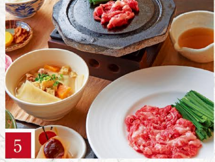
5 阿蘇庭 山見茶屋 さくら膳 1,980円