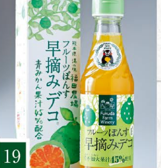
19 福田農場 フルーツぼんす早摘みデコ 【1本/250ml】 596円