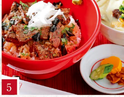
5 阿蘇庭 山見茶屋 あか牛丼 1,440円