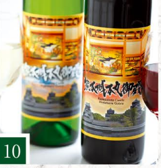
10 くまもと酒蔵 熊本城本丸御殿【赤・白】 【各1本/720ml】 1,625円