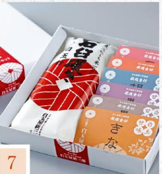
7 白玉屋新三郎 白玉手づくりセット箱 【白玉粉180g・甘味6種×各1】 864円