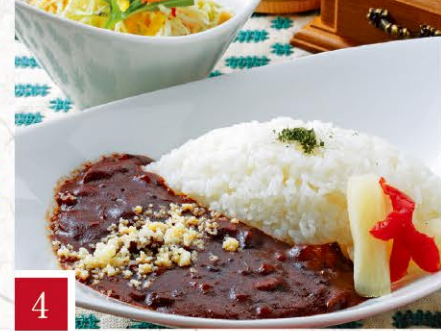
4 茶房 櫻ン坂 あか牛のハヤシカレー 【サラダ付き】 900円