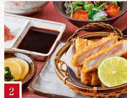
2 和食 櫻道 肥皇豚かつ膳 1,680円