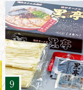
9 旬彩館 黒亭ラーメン4食入 【1箱】 1,620円