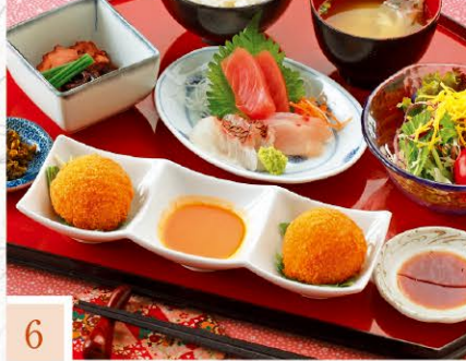
6 天草海食まるけん 名物うにコロッケセット 1,944円