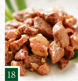
18 馬肉専門店 菅乃屋 馬肉炭火烧 【100g】 600円