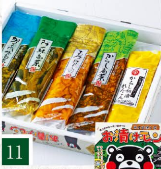
11 阿蘇高菜漬本舗 菊屋 お漬けモン 【100g×5種類】 1,080円