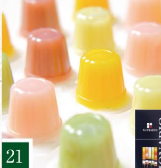
21 MONARIO(もなりお) 豆乳フルーツプリンアソート 【20個入/5種類×各4】 1,404円