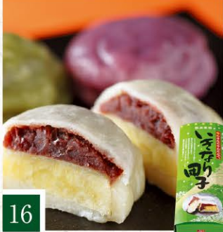
16 いきなりわたなべ 城彩苑限定いきなり団子セット 【8個入/定番×4・限定×4】 1,450円