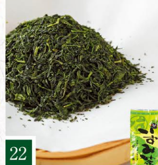
22 いすみ茶 お茶の泉園 いずみ茶 香 【100g】 864円