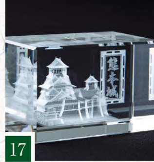
17 小間物や みやび 熊本城3Dクリスタルオブジェ 【1個】 2,160円