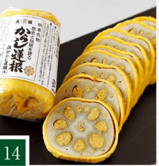
14 森からし蓮根 元祖 森からし蓮根 【中サイズ】 1,080円