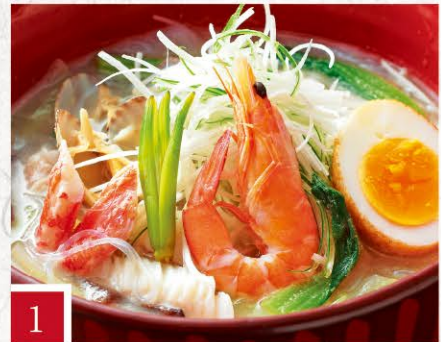
1 肥後めしや 夢あかり 太平燕(タイピーエン) 880円