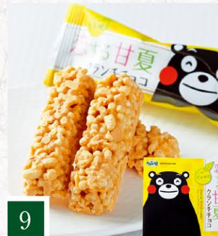
9 旬彩館 恋する甘夏クランチチョコ 【32本入】 1,080円